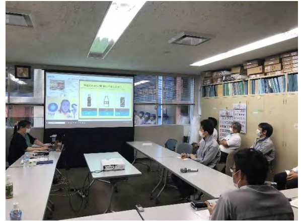
支店での受講風景