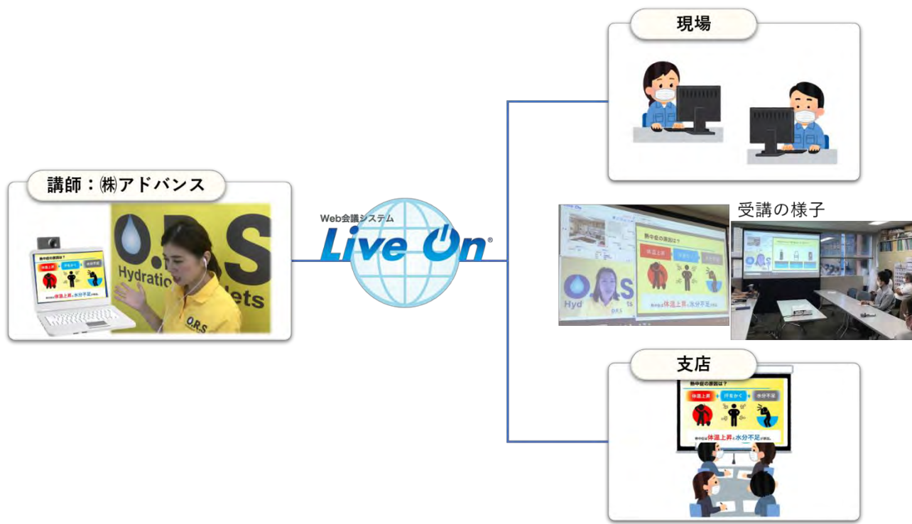
WEB 会議システムを使ったセミナー