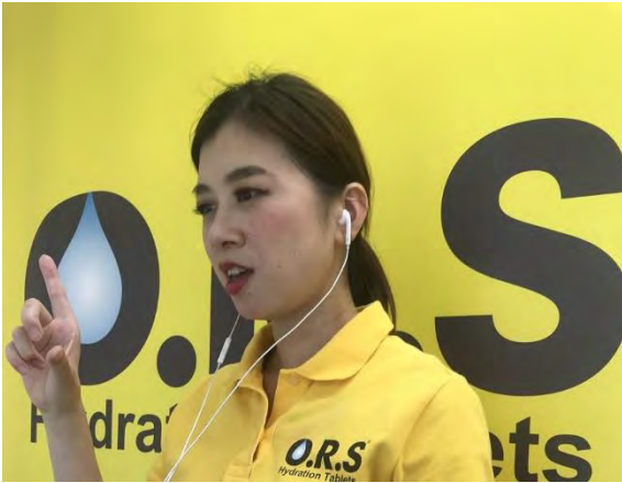
(株)アドバンス 講師